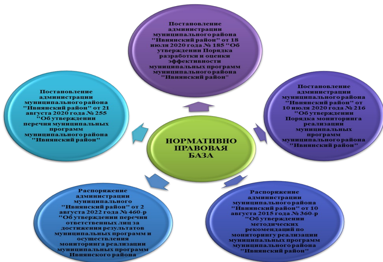
Рис. 1. Нормативная правовая база по вопросам разработки, реализации и оценки эффективности муниципальных программ района