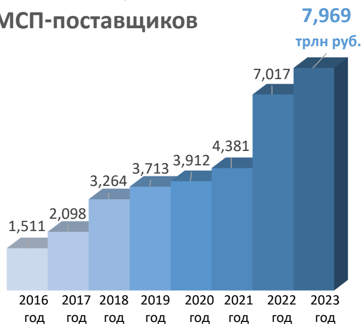
Объем закупок у МСП-поставщиков